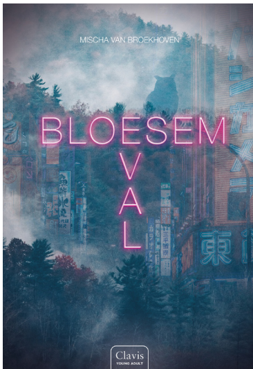
Mischa van Broekhoven Bloesemval Uiteverij Clavis, 2023