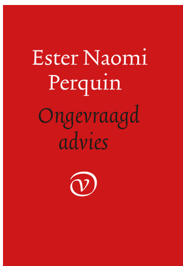
Ester Naomi Perquin Ongevraagd advies Uitgeverij van Oorschot, 2022