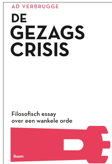
Adriaan Verbrugge De Gezagscrisis Boom uitgevers, 2023