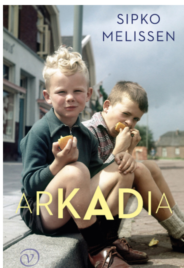
Sipko Melissen Arkadia Uitgeverij van Oorschot, 2023